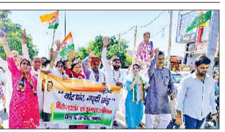
मंडी अटेली। वोट चोर गद्दी छोड़ का नारा लगाकर पैदल मार्च निकालते हुए।

ले जाएगी। भाजपा जनता का वोट देने का अधिकार छीनना चाहती है, लेकिन कांग्रेस संविधान की रक्षा के लिए संघर्ष करेगी। अभियान के दौरान बड़ी संख्या में कार्यकर्ताओं और आम लोगों ने हस्ताक्षर कर भाजपा सरकार का विरोध जताया। राहुल गांधी जब चुनाव वोट चोरी की बात करते हैं तो चुनाव आयुक्त कुछ नहीं बोलते हैं। केंद्र सरकार पर चुनावी धांधली, जीएसटी के नाम पर जनता की लूट व किसानों की अनदेखी जैसे गंभीर आरोप लगाए। जीएसटी के नाम पर लोगों को गुमराह किया जा रहा है। अगर असल में जीएसटी कम हुई है तो ना तो पेट्रोल के दाम कम हुए ना ही डीजल के तो फिर केंद्र सरकार लोगों को क्यों गुमराह कर रही है। यह अभियान कांग्रेस के वरिष्ठ नेता राहुल गांधी द्वारा शुरू की गई मुहिम का हिस्सा है। जिला प्रधान सतवीर झुनिया ने बताया कि यह जन आंदोलन आने वाले समय में