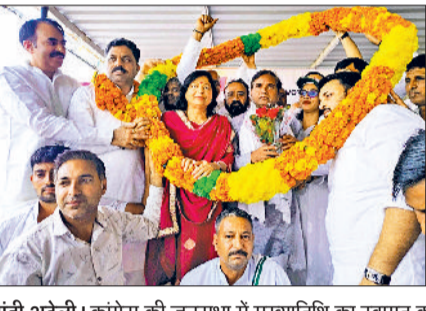
मंडी अटेली। कांग्रेस की जनसभा में मुख्यातिथि का स्वागत करते हुए कांग्रेस कार्यकर्ता तथा जनसभा में उपस्थित लोग।

जनसभा के बाद नारनौल-रेवाड़ी रोड पैदल मार्च किया। इस दौरान कांग्रेसियों ने नारेबाजी की। हरिभूमि न्यूज ▶▶ मंडी अटेली