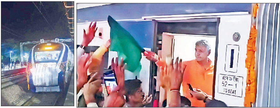
महेन्द्रगढ़। महेन्द्रगढ़ में उतराव करती वंदे भारत ट्रेन को हरी झंडी दिखाते सांसद चौधरी धर्मबीर सिंह।

जिन्होंने ट्रेन को हरी झंडी दिखाकर रवाना भी किया। बता दें कि वंदे भारत ट्रेन महेन्द्रगढ़ स्टेशन पर सायं 8 बजे पहुंची। ट्रेन का स्वागत करने के लिए सैकड़ों की संख्या लोगों ने पहुंचकर गर्मजोशी से स्वागत किया। इस ट्रेन को हरियाणा में महेन्द्रगढ़ सहित कुल 4 रेलवे स्टेशनों पर उतराव की मंजूरी दी गई है। प्रधानमंत्री नरेंद्र मोदी ने राजस्थान के बांसवाड़ा में आयोजित एक कार्यक्रम से वचुंअल