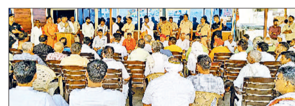
महेन्द्रगढ़। कार्यकर्ताओं को संबोधित करते मंत्री कृष्ण बेदी।