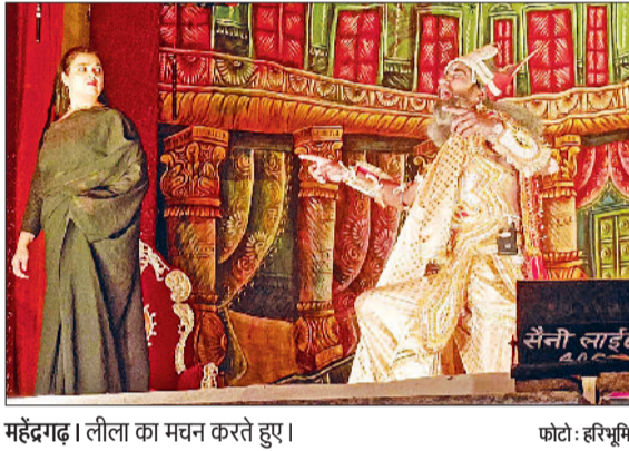
महेन्द्रगढ़। लीला का मंचन करते हुए।