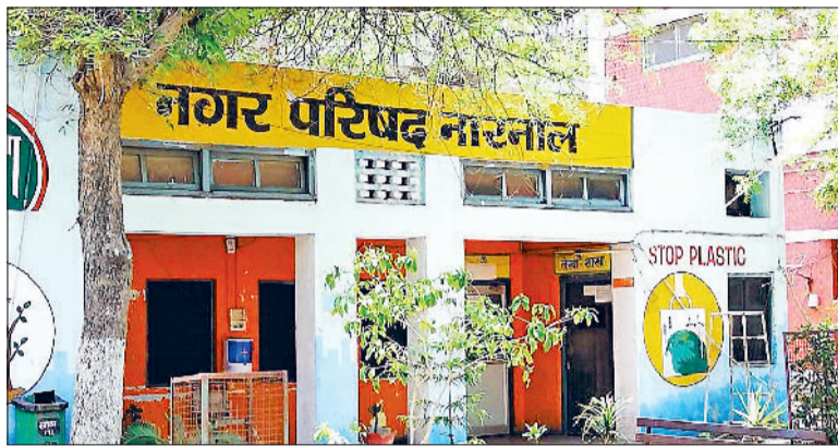
नारनौल। नगर परिषद भवन।