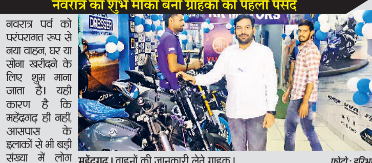
महेन्द्रगढ़। वाहनों की जानकारी लेते ग्राहक।

चार पहिया वाहन की कीमत एक लाख रुपये तथा दोपहिया वाहन की कीमत में 10 हजार रुपये तक की कमी आई नवरात्र का शुभ मौका बना ग्राहकों की पहली पसंद नवरात्र पर्व को परंपरागत रूप से नया वाहन, घर या सोना खरीकने के लिए शुभ माना जाता है। यही कारण है कि महेंद्रगढ़ ही नहीं, आसपास के इलाकों से भी बड़ी संख्या में लोग वाहन खरीदने शोरूम पहुंच रहे हैं। इस दौरान शोरूमों में सुबह से लेकर देर रात तक ग्राहकों की भीड़ लगी रहती है। कई शोरूम संचालकों ने बताया कि ग्राहकों की डिमांड के चलते उन्हें अतिरिक्त स्टॉक मंगवाना पड़ा है।