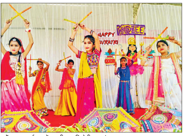
महेन्द्रगढ़। कार्यक्रम में अपनी प्रस्तुति देती छात्राएं।

(अकादमिक एवं इंडस्ट्रियल) ने कहा कि कोरोना महामारी के बाद यह विश्वविद्यालय परिसर में आयोजित पहला जाँब फेयर है। वहीं, प्रोफेसर (डॉ.) पी.एस. जयसल ने धन्यवाद ज्ञापन प्रस्तुत किया। कार्यक्रम का संचालन डॉ. अलोक कुमार ने किया। इस मेले में संसरा इंजीनियरिंग लिमिटेड, रिसेंट प्रिंसिपल लिमिटेड, र्लोबल ऑटो टेक लिमिटेड, बुचर हाइड्रोलिक्स प्राइवेट लिमिटेड, हिंदवेयर लिमिटेड, मासू ब्रेक पैड्स प्राइवेट लिमिटेड, सेलोट्रेप ईपीपी इंडिया प्राइवेट लिमिटेड, वर्धमान यार्न एंड थ्रेड प्राइवेट लिमिटेड, कैनन इंडिया, एस्को कार्स्टिंग एंड इलेक्ट्रॉनिक्स प्राइवेट लिमिटेड, पॉली मॉडिकल क्योर कंपनी और शिप्रो टेक कंपनी जैसी प्रमुख कंपनियों ने भाग लिया।