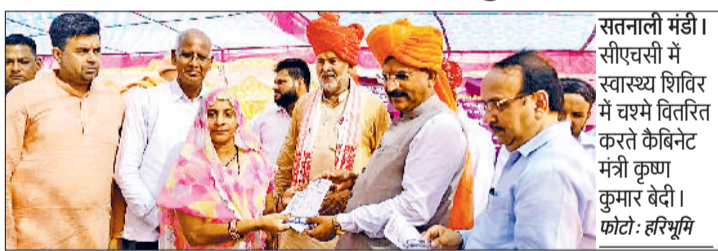
सतनाली मंडी। सीएवसी में स्वास्थ्य शिविर में चर्चे वितरित करते कैबिनेट मंत्री कृष्ण कुमार बेदी।

सतनाली मंडी। आमजन को स्वास्थ्य सेवाएं जहां दूध दही का खाना से जाना जाता है, सरल व सुलभ बनाने के लिए राष्ट्रीय स्वास्थ्य लोकिन महिलाओं की जब स्वास्थ्य की जांच मिशन के तहत स्वास्थ्य विभाग की ओर से होती है, तो रक्त व आयरन की कमी पाई स्वस्थ नारी सशक्त परिवार अभियान के तहत सामुदायिक स्वास्थ्य केंद्र सतनाली में स्वास्थ्य जांच शिविर का आयोजन किया गया। जिसका शुभारंभ सामाजिक न्याय एवं अधिकारिता मंत्री कृष्ण बेदी ने किया। कार्यक्रम में मुख्य अतिथि ने 75 वर्ष से अधिक आयु के लोगों को आयुष्मान कार्ड वितरित किए। इस सीजन में महिलाओं की अत्यंत जांच कराएँ और ही अवसर पर मंत्री ने कहा कि महारा हरियाणा सच्चिन्यों का सेवन करें।