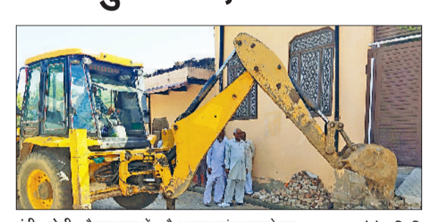
मंडी अटेली। दौगड़ा जाट में अवैध कब्जा स्वयं हटवाते हुए।