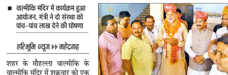
महेन्द्रगढ़। मंत्री कृष्ण बेदी को पगड़ी पहनाकर स्वागत करते समाज के लोग।

महर्षि वाल्मीकि का जीवन समाज के लिए प्रेरणा का सागर है। उनकी हर बात समाज को नई दिशा देने का काम करती है। मंत्री कृष्ण बेदी ने कहा कि महर्षि वाल्मीकि का जीवन समाज के लिए प्रेरणा का सागर है। उनकी हर बात समाज को नई दिशा देने का काम करती है।