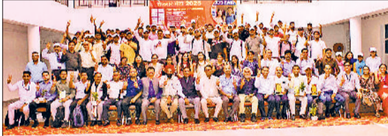
नारनौल। जाँब फेयर मेले में भाग लेने वाले प्रतिभागी।