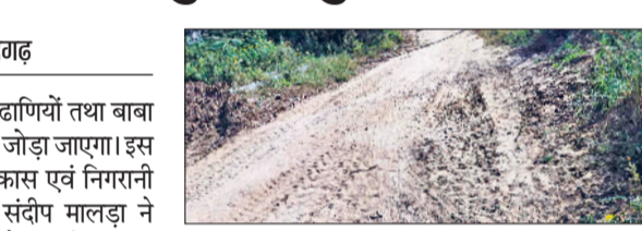
महेन्द्रगढ़। ढाणी का कच्चा रास्ता।